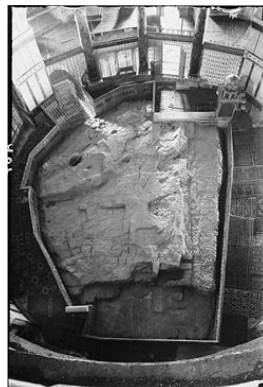
צילום אבן השתייה

אם-כן, אֲשֶׁרִי הַמְּחַפֶּה... (דניאל יב' 12) = מכוון לרגע בו כספת אבן השתייה "האבן הראשה" תנופץ... כלומר, לרגע בו יתגלו הלחות = (דברים י' 5) = וְאֲשֶׁם אֶת-הַלְּחֹת בְּאֶרֶון אֲשֶׁר עָשִׂיתִי וַיְהִיו שָׁם... השמורים בכספת האבן... היא, כספת האבן, האבן הראשה אותה ייסד שְׁרָיָה כֶּהֵן הָרֵאשִׁ... = (ירמיה נב' 24) = לאחר החורבן ככספת, מאבני המקדש שחרב. בה, בכספת האבן, נשמרים לוחות הברית שמא יפלו בשבי בידי זרים - עד-מתי? פי למועד מועדים וְחָצִי וְכִכְלוֹת נִפְץ יָד-עַם-קִדְשׁ--תִּכְלִינָה כָּל-אֱלֹהִים... (דניאל יב' 7)