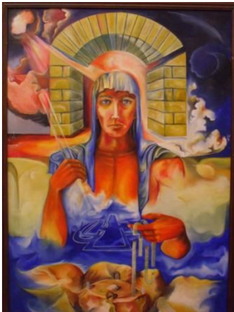
זאת תֹּרַת הַבַּיִת... (יחזקאל מג' 12) בקיום חוק שימור כמות

וְהָיָה-אִישׁ מֵרְאֵהוּ כְּמֵרְאֵה נְחֻשֶׁת וּפְתִיל-פְּשֻׁתִים בְּיָדוֹ וּקְנֵה הַמִּדֵּה וְהוּא לְמֹד בְּשֶׁעַר... (יחזקאל מ' 3)