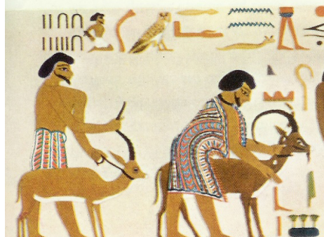
קטע זה של ציור הקיר כולל את שם אֲבִישִׁי והמספר 22 + 15 = 37

והואיל וְאַהֲבַת אפשר לתת ולקבל רק באמצעות = (בראשית א' 2) = רוח אלהים... והואיל ואותה רוח של אלהים היא אשר נפח במקדש ובאדם לנשמת חיים = (בראשית ב' 7) = וַיִּפַּח בְּאַפּוֹ נֶשְׁמַת חַיִּים וַיְהִי הָאָדָם לְנֶפֶשׁ חַיָּה... = (חגי א' 9) = הַבַּיִת וְנִפְחֲתִי בוֹ... והואיל וכך הוא... יכול אני להציע לך להבין על מה עוד נאמר שימור כמות... שימור כמות: [אל-ישר]=[22+15]=[ישראל] משמר תיעוד למסר היסטורי המתאר את ירידת יעקב למצרים, בכתובת שיוחסה ליוסף "צִפְנַת פְּעֻנַח" ותוארכה לשנת 6 למלכות פרעה ח'-חיפר, בציור הקיר במקדש קבר הנסיך חנום חותפ' II.