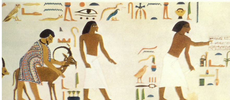
קטע מצויר קיר במקדש קבר חנוס חותפי II (בני-חסן מצרים) בו מתועדת כתובת כי: "יוסף מביא את יעקב למצרים..."